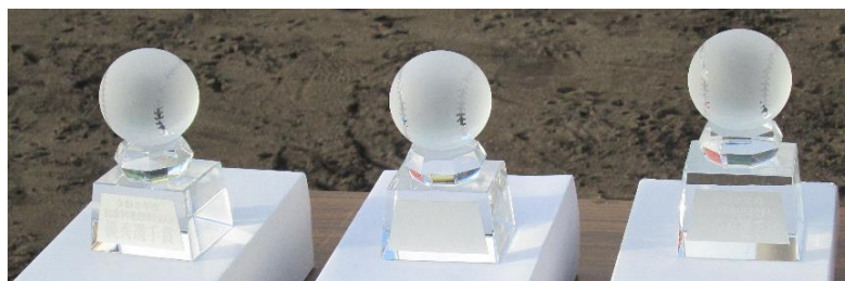
個人賞 優秀選手賞 優秀選手賞 最優秀選手賞