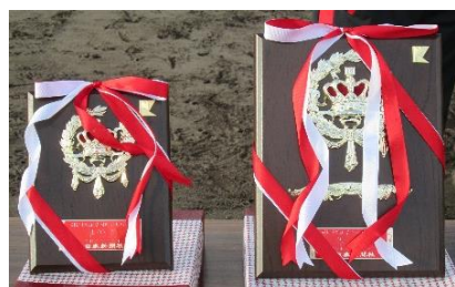
北日本新聞社賞 準優勝盾 優勝盾

3位「氷見EAST」優勝「新湊硬式クラブA」準優勝「HARD BALL CLUB金沢Jr.」